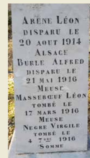
Le monument aux morts d'Esparron, 1914-1918. Détail.

« ...Nous venons déposer des fleurs devant leur monument et nous avons une pensée émue et reconnaissante pour ces héros, pour ces martyrs. Les uns dorment à côté de nous leur dernier sommeil, d'autres sont restés là-bas, aux frontières et dans les immenses nécropoles (7) ... »