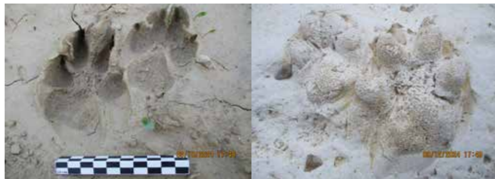
Empreintes in situ

Le mardi 29 octobre dernier, sur le plateau au-dessus d'Albosc, non loin de la source de Poiraque, deux empreintes qui pourraient être celles d'un loup ont été repérées ! Elles se trouvaient en contrebas d'un champ, à l'orée du bois, au fond d'une ornière de labour où l'eau des fortes pluies des jours précédents avait laissé place à une fine boue.