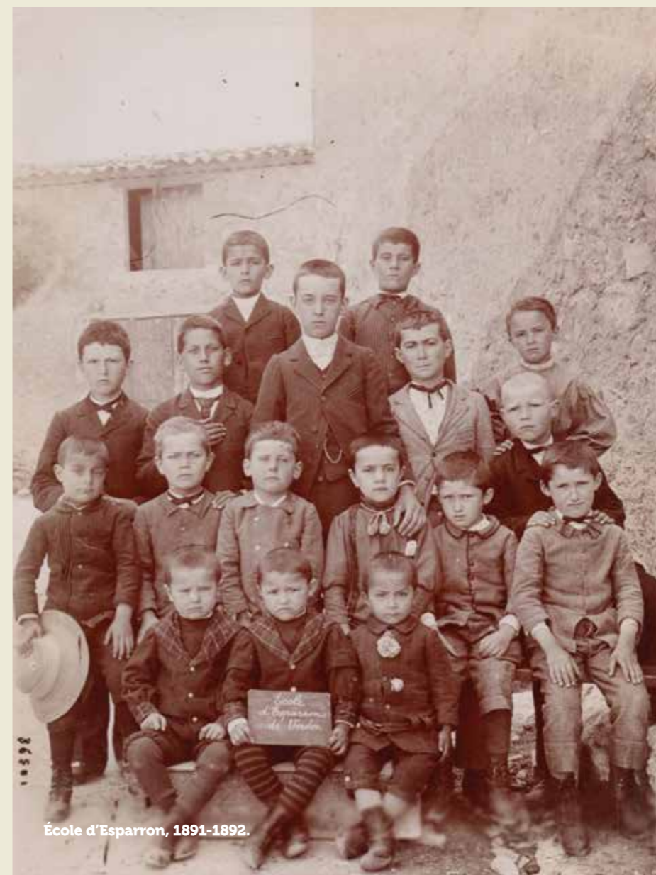
École d'Esparron, 1891-1892.

Puis vient le temps du Service militaire, qu'il effectue à Toulon, au 111 ème Régiment d'Infanterie (4 ème Compagnie) durant 3 années (4) .