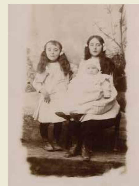
Les trois filles désormais sans leur père.

Un joli cadre d'hommage de la nation, une plaque oxydée portant le nom du défunt, quelques photographies... et surtout le sentiment d'un grand gâchis.