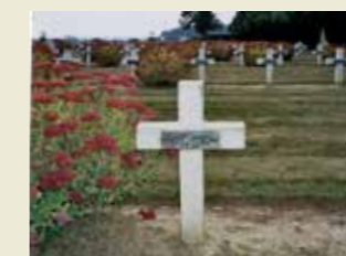
Tombe de Virgile Nègre, nécropole de Lihons, près d'Amiens.