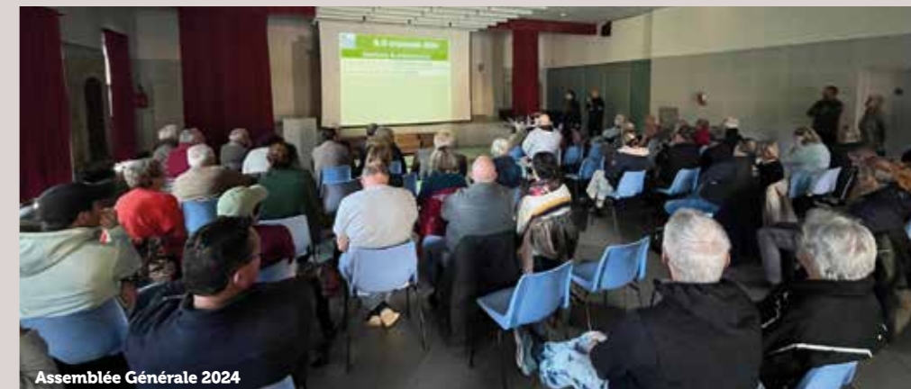
Assemblée Générale 2024

L'équipage du CNEV vous souhaite de Bonnes Fêtes de fin d'année et vous donne rendez-vous en Mars 2025 pour de nouvelles aventures !