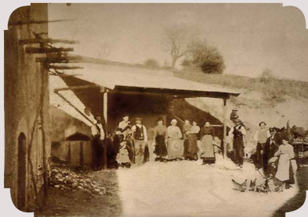
quelques villageois Albiciens et Albiciennes, descendants des Albices ? Unique carte photo éditée sur Albiosc, vers 1910 ?

« ...César vante leur bravoure et leur intrépidité ; il les montre comme balançant la brillante ardeur et la pétulante valeur de ses propres soldats. Dans son livre second, le général historien